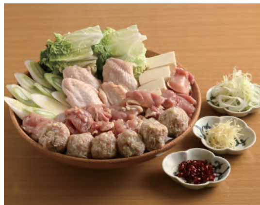
とり鍋 (鶏もも・つくね・野菜・豆腐)