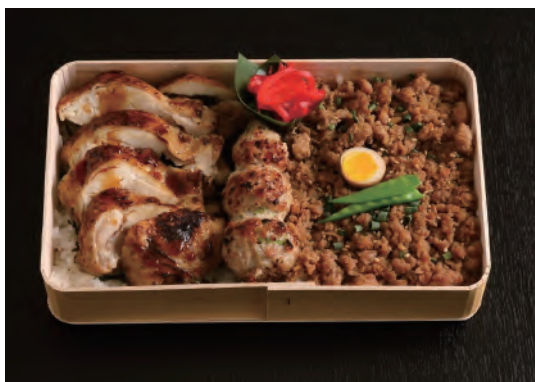
鳥たけ重弁当 (おみやげ)