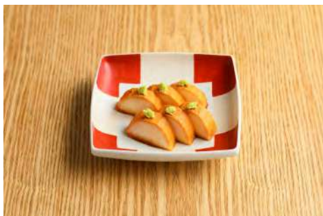
長いもたまり漬け